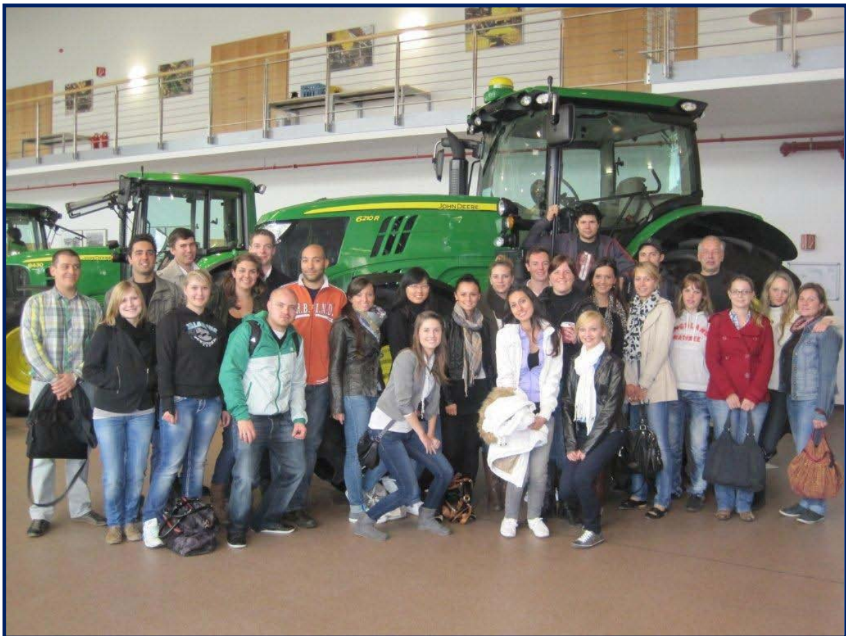
Die Studierenden des 5. Semesters IM Bachelor und des 2. Semesters im Masterprogramm IM

Die Studierenden wurden hier durch das komplette Werk geführt und lernten alle Fertigungsabläufe in der Produktion von Traktoren – vom Getriebe bis zum fertigen Traktor – kennen.