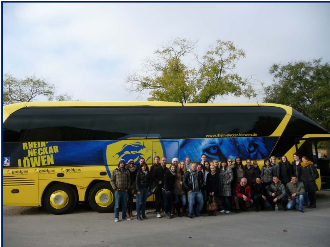
Die Studierenden des 5. Semesters IM Bachelor und des 2. Semesters im Masterprogramm IM

Nach der interessanten Führung durchs Logistikzentrum wurde als nächste Station Speyer angefahren: Nach einer Stärkung in der Hausbrauerei wurden Dom und die Innenstadt besichtigt.