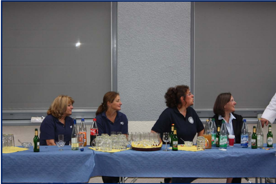
Kollegen beim Plausch: